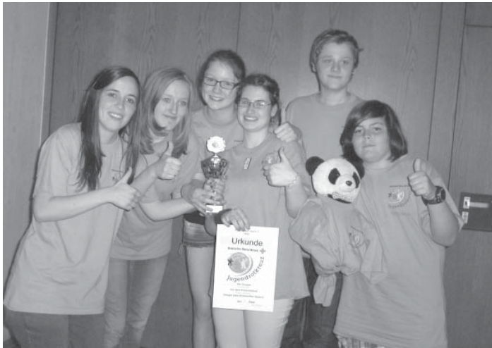
Die erfolgreichen Teilnehmer des Jugendrotkreuzes Sasbach nach der Siegerehrung in Fautenbach.