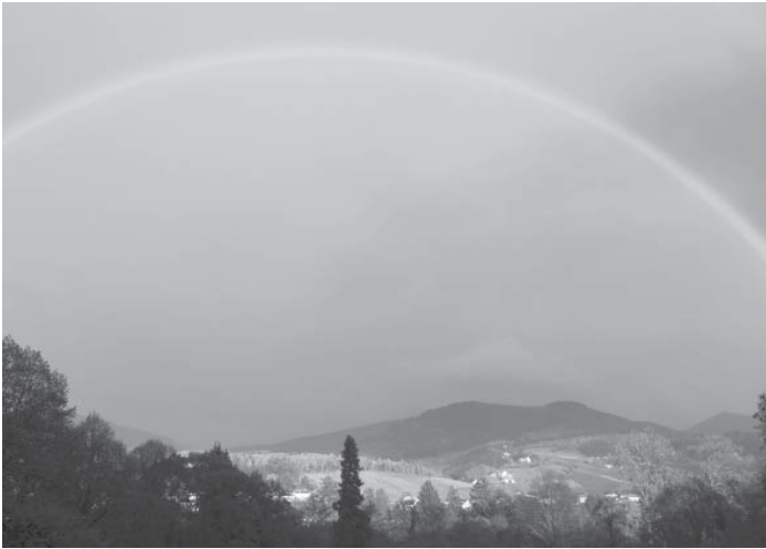
Aufgenommen vom Kloster Erlenbad April 2012 - Graziella Labartino